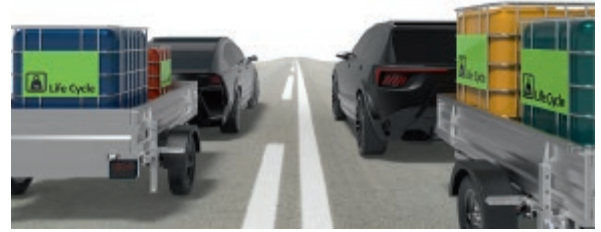
Bild 1. Stark vereinfachtes Symbolbild zweier Fahrzeuge mit ihrer dank der Lebenszyklusbeurteilung vergleichbaren Emissionlast

Lebenszyklusanalysen sind im Mobilitätssektor nicht der Standard. Vielmehr werden sogenannte Well-to-Tank-, Tank-to-Wheel-, oder – die Kombination aus beidem – Well-to-Wheel(WtW)-Analysen durchgeführt.